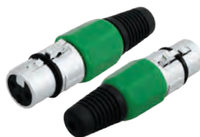
14-0545 Гнездо «CANON» XLR

Предназначено: для монтажа на шнур Корпус: зеленый В упаковке: 20 шт В коробке: 500 шт