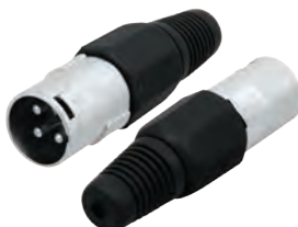
14-0551 Штекер «CANON» XLR

Предназначен: для монтажа на шнур Корпус: черный В упаковке: 20 шт В коробке: 500 шт