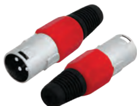
14-0553 Штекер «CANON» XLR

Предназначен: для монтажа на шнур Корпус: красный В упаковке: 20 шт В коробке: 500 шт