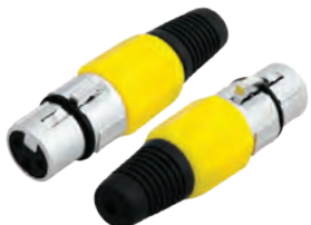
14-0544 Гнездо «CANON» XLR

Предназначено: для монтажа на шнур Корпус: желтый В упаковке: 20 шт В коробке: 500 шт