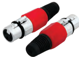
14-0543 Гнездо «CANON» XLR

Предназначено: для монтажа на шнур Корпус: красный В упаковке: 20 шт В коробке: 500 шт