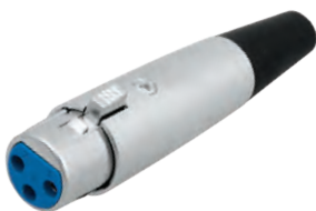
14-0511 Гнездо «CANON» XLR

Предназначено: для монтажа на шнур Корпус: металл В упаковке: 10 шт В коробке: 500 шт