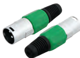
14-0555 Штекер «CANON» XLR

Предназначен: для монтажа на шнур Корпус: зеленый В упаковке: 20 шт В коробке: 500 шт