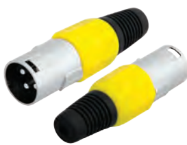
14-0554 Штекер «CANON» XLR

Предназначен: для монтажа на шнур Корпус: желтый В упаковке: 20 шт В коробке: 500 шт