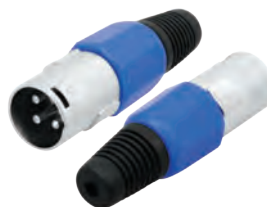
14-0552 Штекер «CANON» XLR

Предназначен: для монтажа на шнур Корпус: синий В упаковке: 20 шт В коробке: 500 шт