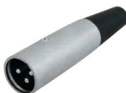
14-0513 Штекер «CANON» XLR

Предназначен: для монтажа на шнур Корпус: металл В упаковке: 10 шт В коробке: 500 шт