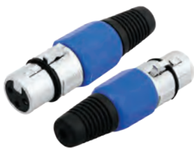
14-0542 Гнездо «CANON» XLR

Предназначено: для монтажа на шнур Корпус: синий В упаковке: 20 шт В коробке: 500 шт